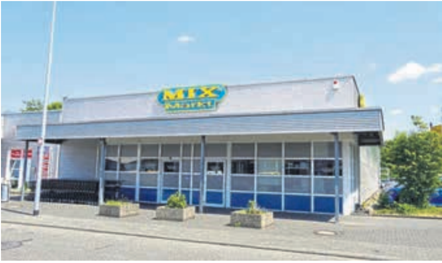
Auf rund 450 Quadratmetern finden Kunden im Mix-Markt Neuwied eine große Auswahl an internationalen Spezialitäten und frischen Produkten.

Seit mittlerweile 20 Jahren ist auch die Filiale in Neuwied ein fester Anlaufpunkt für Kundinnen und Kunden aus der gesamten Region. Auf rund 450 Quadratmetern Verkaufsfläche bietet der Markt ein Sortiment mit et-