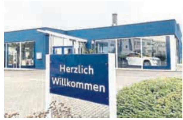
Das Autohaus Sommer ist seit Jahrzehnten fester Bestandteil des Gewerbebestands Neuwied-Distelfeld.

NEUWIED. -jke- Das Autohaus Sommer steht seit mehr als 60 Jahren für Kompetenz, persönlichen Service und Kundennähe rund ums Automobil. Auch der Standort im Gewerbegebiet Neuwied-Distelfeld ist längst fest etabliert und gehört seit über 25 Jahren zum familiengeführten Unternehmen. Gemeinsam mit dem Firmensitz in Straßenhaus verbindet der Betrieb langjährige Erfahrung mit moderner Werkstatttechnik, fachkundiger Betreuung und umfassendem Service als Peugeot-Servicepartner.