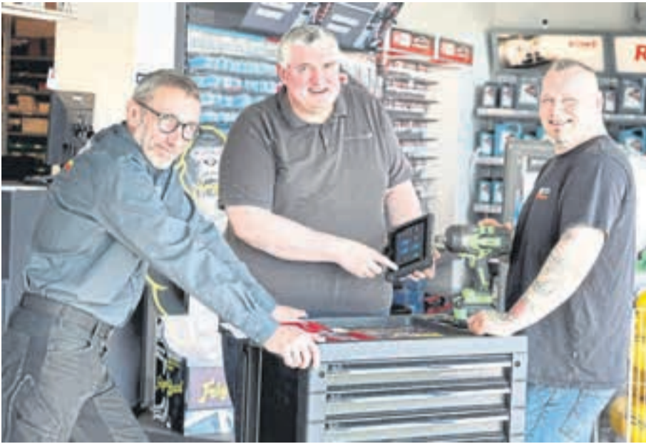
Seit Januar 2025 ist Autoteile Esper auch mit einem Standort in Neuwied vertreten und bietet dort Ersatzteile, Zubehör und persönliche Beratung rund ums Fahrzeug.

Seit über fünf Jahrzehnten steht das Familienunternehmen für kompetenten Service und schnelle Lösungen. Gegründet im Jahr 1968 von Wolfgang Esper, hat sich der Betrieb kontinuierlich weiterentwickelt und ist heute mit drei Standorten in Rheinland-Pfalz vertreten. Zusätzlich zu dem Haupthaus in Mayen gibt es die Filiale in Cochem und seit Januar 2025 den Standort in Neuwied.