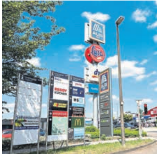
Zwischen Friedrichshof, Distelfeld und Meerheck entstehen wichtige Impulse für die wirtschaftliche Entwicklung und zukünftige Unternehmensansiedlungen in Neuwied.