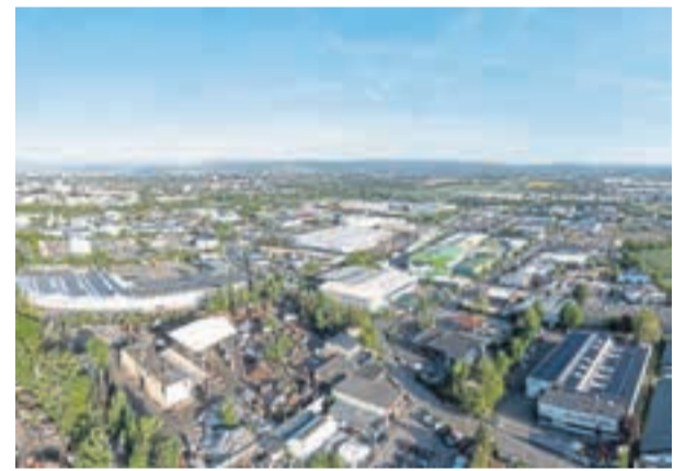
Am Friedrichshof schafft die Stadt Neuwied neue Perspektiven für Unternehmen und künftige Gewerbeansiedlungen.

Im Mittelpunkt steht dabei der Friedrichshof. Hier verfolgt die Stadt eine aktive Erweiterungsstrategie. Aktuell werden in größerem Umfang Grundstücke angekauft, um das Gewerbegebiet perspektivisch auszubauen und neue Flächen zu erschließen. Der Ansatz dahinter ist bewusst gewählt. Ziel ist es, nicht nur auf Anfragen zu reagieren, sondern die Entwicklung aktiv zu steuern. Durch den Flächener-