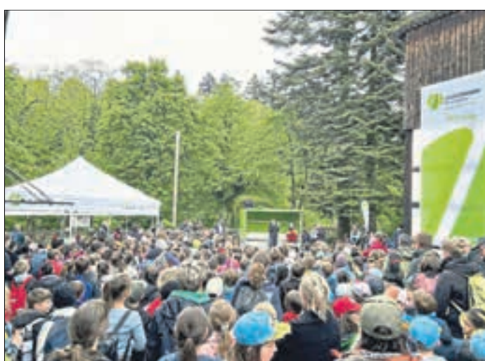
Siegerehrung der Wald-Jugendspiele am Forstamt Koblenz.

So fanden sie im Wald versteckte Tiersilhouetten und haben den Tieren passende Fußabdrücke, so genannte Trittsiegel, zugeordnet. Sie erfüllten Fröhen verschiedene Bäume, ohne zu gucken. Sie halfen Familie Siebenschläfer über eine Biotopbrücke in den rettenden