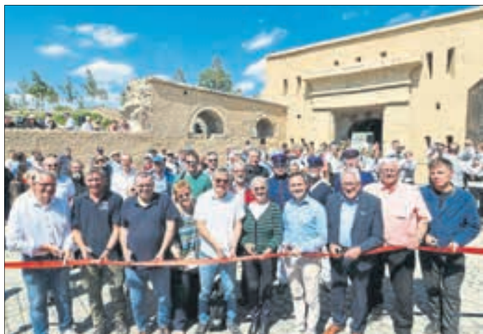
Mit dem symbolischen Zerschneiden des roten Bandes wurde der neue Festungspark Kaiser Franz in Lützel nach neun Jahren Bauzeit offiziell an die Bürger übergeben.