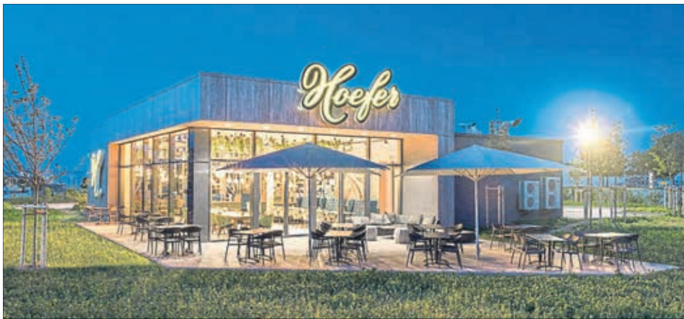
Die Bäckerei-Cafés von Hoefler bieten für ihre Gäste sowohl ein modernes Ambiente wie auch eine gemütliche Atmosphäre mit Innen- und Außenbereichen.

Mit über 40 Bäckerei Cafés gehört die Bäckerei Hoefler zu den größten Bäckereien in Koblenz und seinem Umland. Allein im Koblenzer Stadtgebiet ist das Unternehmen