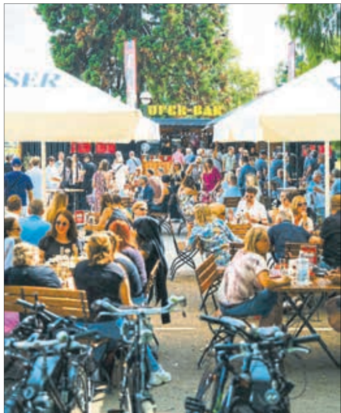
Das Weinfestival Koblenz lädt noch bis Mitte Juli zu Weinproben, Livemusik und besonderen Veranstaltungen an verschiedenen Orten der Stadt ein.

⇒ Das vollständige Programm sowie Tickets für kostenpflichtige Veranstaltungen gibt es unter www.weinfestival-koblenz.de .