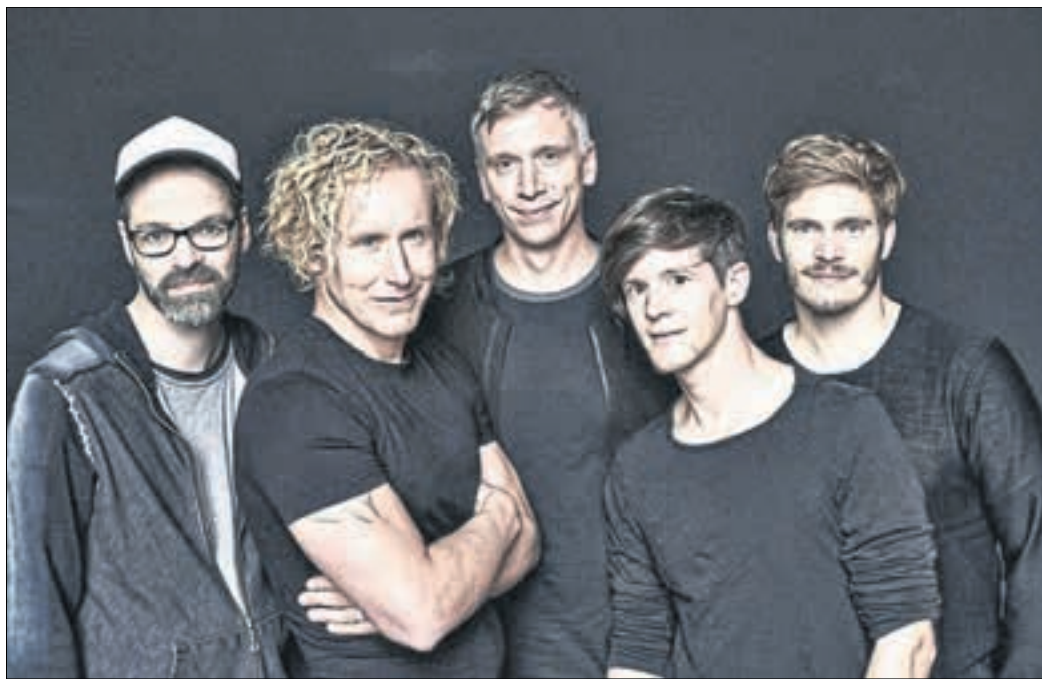
Die Kölner Kultband Kasalla bringt am 26. August kölsche Musik und jede Menge Stimmung auf die Sparkassenbühne der Festung Ehrenbreitstein.

Am 12. Juni gastiert Max Giesinger auf der Sparkassenbühne. Mit seinem neuen Album „Glück auf den Straßen“ bringt der Sänger sommerliche Songs und persönliche Geschichten