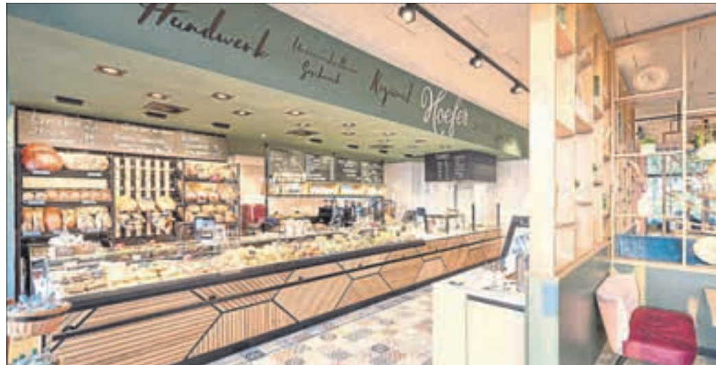
Aus einem großen Angebot an Backwaren und Snacks für jede Tageszeit können die Hoefler-Kunden auswählen.

Mit ihrer langen Geschichte, einem breiten Angebot und hundert Mitarbeitenden steht sie exemplarisch für ein Handwerk, das sich erfolgreich zwischen Tradition, Moderne und Zukunft bewegt. Oder anders gesagt: Ein Stück Koblenz, das man schmecken kann.