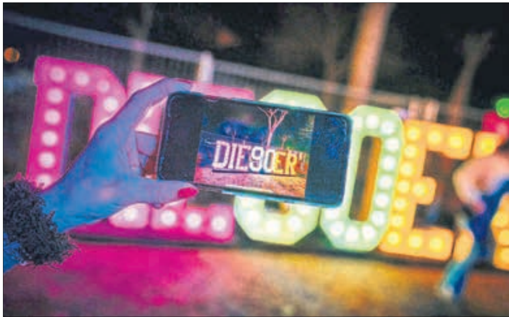
Beim „Feuerwerk der 90er“ am Deutschen Eck treten unter anderem Rednex, Captain Jack, Bellini und Fun Factory auf.

Im Mittelpunkt des Freitagabends steht die große „Feuerwerk der 90er“-Party am Deutschen Eck. Mit internationalen Live-Acts und bekannten Künstlern wie Rednex, Captain Jack, Bellini, Fun Factory, Caught in the Act und Chris Nitro soll die Veranstaltung zahlreiche Besucher anlocken. Für die Party wird es einen Ticketverkauf über die Internetseiten www.die90er.de sowie www.nullsechsst.de geben. Angeboten werden neben regulären Eintrittskarten auch Gruppen- und VIP-Tickets. Parallel dazu entsteht zwischen der Seilbahnstation und den öffentlichen Toiletten die