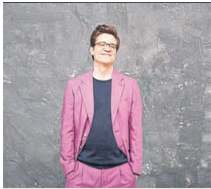
Musikkabarettist Bodo Wartke gastiert mit seinem Programm „Wunderpunkt“ beim Festungssommer auf der Festung Ehrenbreitstein.

dürfen sich am 14. August auf In Extremo freuen. Die Band verbindet seit Jahrzehnten harte Rockmusik mit historischen Instrumenten und spektakulären Bühnenshows. Einen Tag später gastiert die Punkband Sondaschule auf der Sparkassenbühne. Mit Helge Schneider folgt am