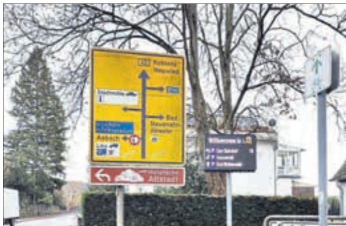
Die neue Anzeigetafel in der Linzhausenstraße zeigt freie Parkplätze am Bahnhof in Echtzeit an.

Kern der Maßnahme ist ein Smart-Parking-System, das auf