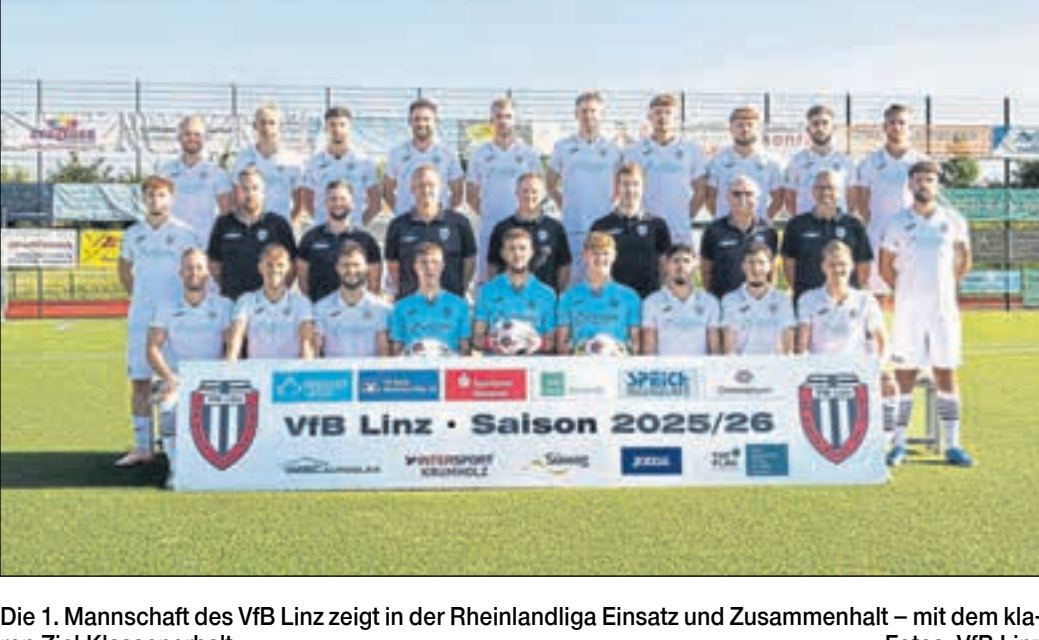
Die 1. Mannschaft des VfB Linz zeigt in der Rheinlandliga Einsatz und Zusammenhalt – mit dem klaren Ziel Klassenerhalt.

Mit Einsatz, Teamgeist und realistischen Chancen auf den Verbleib in der Rheinlandliga