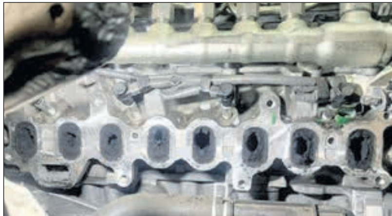
Nusschalenstrahlen: Diesel- aber auch Benzinmotoren neigen beim Kurzstreckenfahren dazu im Ansaugtrakt zu verkoken (siehe Bild).

Wenn Sie neue Reifen benötigen, ist auch hier der Kfz-Meisterbetrieb der richtige Ansprechpartner. Da wir mit einem großen Reifenlieferanten aus Höhr-Grenzhausen zusammen arbeiten, können wir für jeden Wunsch den richtigen Reifen anbieten und