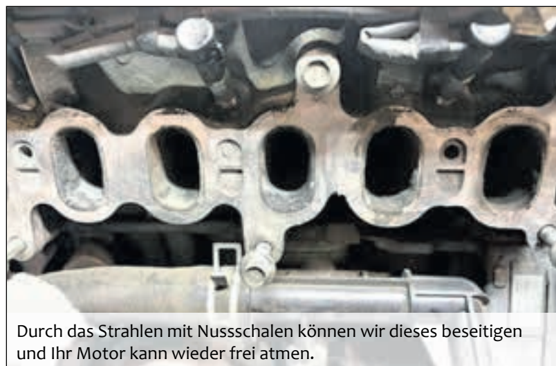
Durch das Strahlen mit Nusschalen können wir dieses beseitigen und Ihr Motor kann wieder frei atmen.