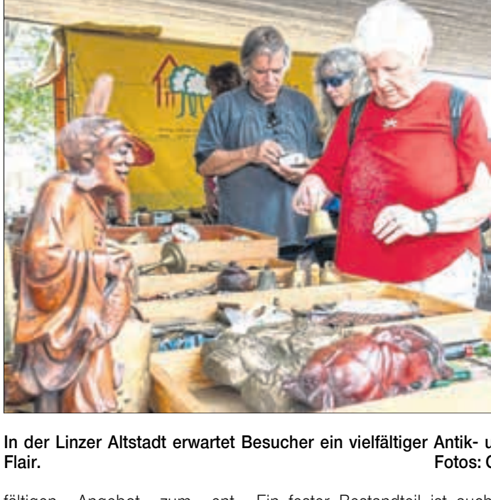
In der Linzer Altstadt erwartet Besucher ein vielfältiger Antik- und Trödelmarkt mit besonderem Flair.

Parallel dazu öffnet auch der Linzer Einzelhandel seine Türen und lädt mit einem viel-