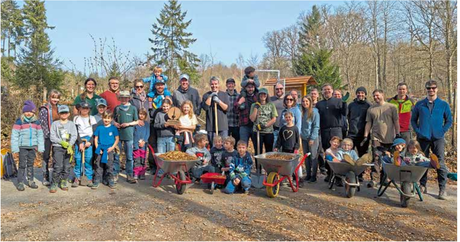
Zahlreiche Helfer der Mountainbikeinitiative Koblenz kamen zusammen, um sich für den regionalen Wald zu engagieren.