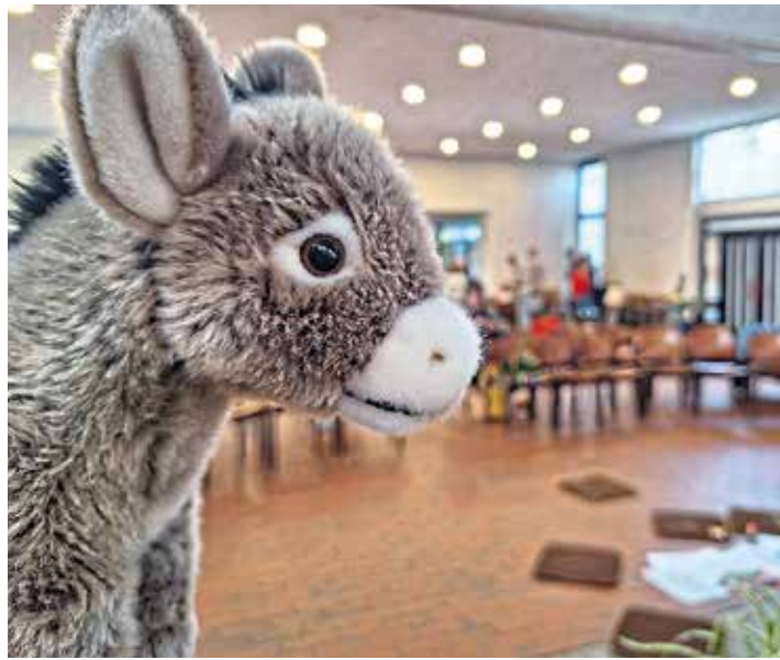
Pastoraler Raum Koblenz.

Eine Premiere hat an Palmsonntag (29. März) in der Kirche St. Hedwig auf der Karthause in Koblenz stattgefunden: Erstmals gab es einen Gottesdienst der „Kirche Kunterbunt“ im Pastoralen Raum Koblenz. Die deutschlandweit wachsende Initiative lädt Menschen aller Altersgruppen ein, Glauben kreativ, lebensnah und gemeinschaftlich zu erleben. Besonders Familien finden hier einen offenen Raum, um Kirche einmal anders kennenzulernen, so die Veranstalter. Rund 50 Teilnehmende kamen zusammen, um in bunter und lebendiger Atmosphäre miteinander zu singen, zu beten und den Palmsonntag zu entdecken. An verschiedenen thematisch gestalteten Stationen konnten Kinder und Erwachsene selbst aktiv