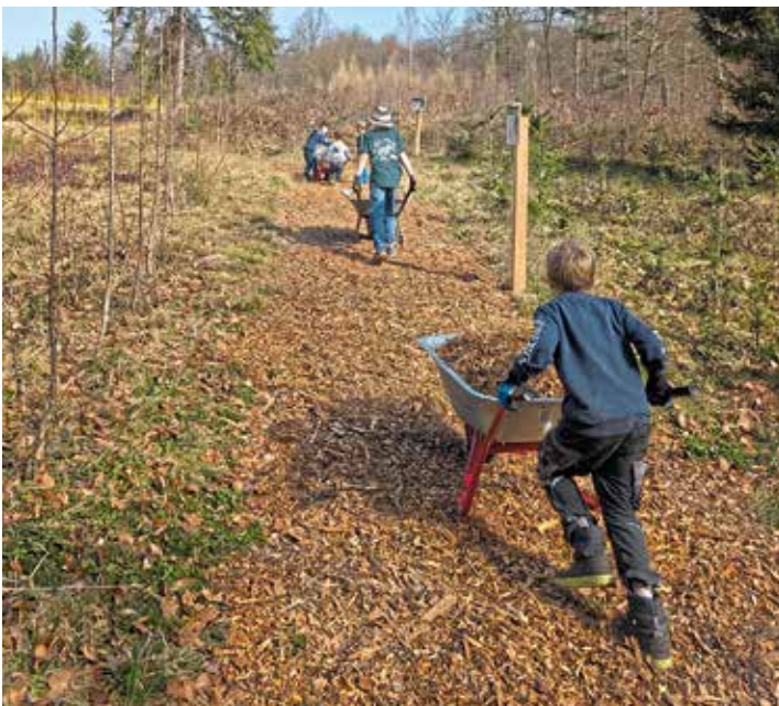
Außerdem wurde der Weg im Klimawald instandgesetzt.