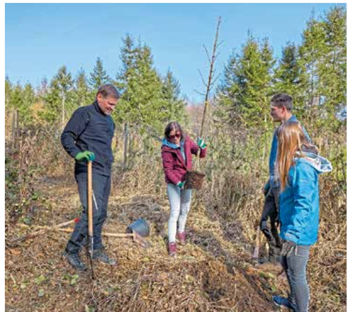
Im Rahmen der Aktion wurde eine Baumallee gepflanzt.