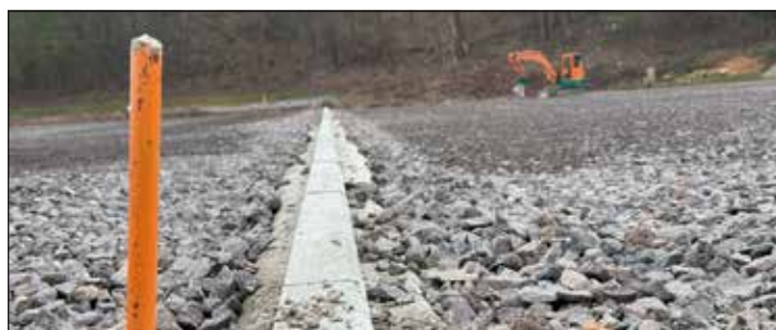
Die ersten Teilarbeiten für die neue Außenanlage sind vollzogen.