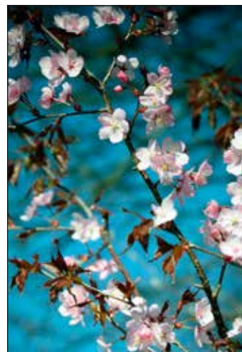
In der Eichendorffstraße zeigen sich zudem seit diesem Jahr rosa Kirschblüten.

neu geschaffenen Baumstandorten zwischen den parkenden Autos stehen dort seit Kurzem 18 Scharlach-Kirschen ( Prunus sargentii ‚Charles Sargent‘). Diese Bäume ersetzen gefällte Exemplare im Zuge des Neubaus der Pfaffendorfer Brücke und fügen sich harmonisch in die Umgebung mit zahlreichen blühenden Magnolien ein. Auf der Karthause werden erstmals Tokio-Kirschen ( Prunus yedoensis ) gepflanzt, bekannt für ihre üppigen weißen Frühlingsblüten. Drei dieser Bäume kommen demnächst auf den Berliner Ring. Ob sie sich zu ähnlich beliebten Fotomotiven entwickeln wie die rosafarbenen, japanischen Nelkenkirschen ( Prunus serrulata ) auf der Mittelach-