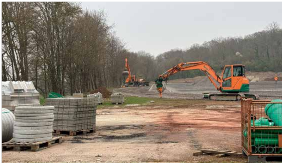
Die Bauarbeiten des ersten Bauabschnittes zum Neubau der Außenanlagen „Schmitzers Wiese“ verlaufen nach Zeitplan.

Grund hierfür war der in die Jahre gekommene Zustand der bereits vorhandenen Außenanlage. Die notwendigen Funktionen als innerstädtische und überregionale Sportstätte wurden nicht mehr erfüllt. Es ist vorgesehen, die Kampfbahn mit einem Kernspielfeld in Kunstrasen für den Fußballsport, die Laufbahn und die Segmente mit Kunststoffbelag für die leichtathletische und multisportliche Nutzung auszustatten. Zudem wird im vorderen Bereich eine Beachvolleyballfläche entstehen. „Ich bin froh, dass der Ausbau der Bezirkssportstätte „Schmitzers Wiese“ gut verläuft und wir wahrscheinlich Ende