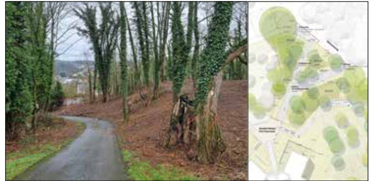
Die alte Zufahrt des Fort Asterstein ist zu steil, sie wird zurückgebaut.

Feuerwehr kann die Steigung nur mit Mühe bewältigen. Die bestehende Zufahrt wird zurückgebaut und entsiegelt. Parallel zur Straße wird auch ein neuer Fußweg vom Kolonnenweg zum Vorplatz des Reduits gebaut. Die neue Straße wird auch für den weiteren Ausbau der Gebäude benötigt. Derzeit entsteht im Torhaus ein neues Infozentrum über das Projekt „Festungsstadt Koblenz“ und die Geschichte der Festung Koblenz und Ehrenbreitstein. Umgeben ist das Torhaus von einem Platz, der mit Fördermitteln zu einem „neuen historischen Zentrum“ des Stadtteils Asterstein umgestaltet werden soll. Zudem ist geplant, das Reduit zu sichern und langfristig wieder nutzbar zu machen. Die Arbeiten sind Teil des umfassenden Projekts „Festungsstadt Koblenz“, für das hohe Zuschüsse des Bundes aus der Städtebauförderung