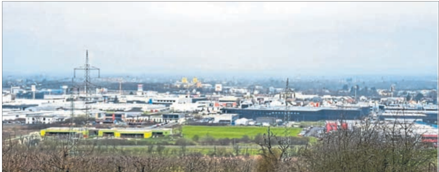
Der InnovationPARK befindet sich in stetigem Wachstum.

InnovationPARK Mülheim-Kärlich bietet eine dynamische Umgebung für Unternehmen