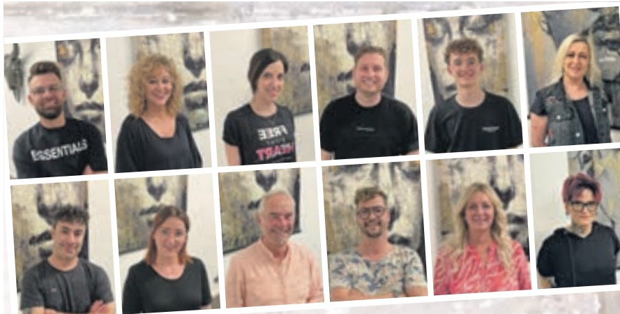
Das Hairkiller-Team ist hoch motiviert und freut sich auf junge und jung gebliebene Leute, die Lust an ausgefallenem Frisurenstyling haben und Haarfarbe lieben.

Hairkiller Industriestraße 38 56218 Mülheim-Kärlich ☎ (02630) 957 600.