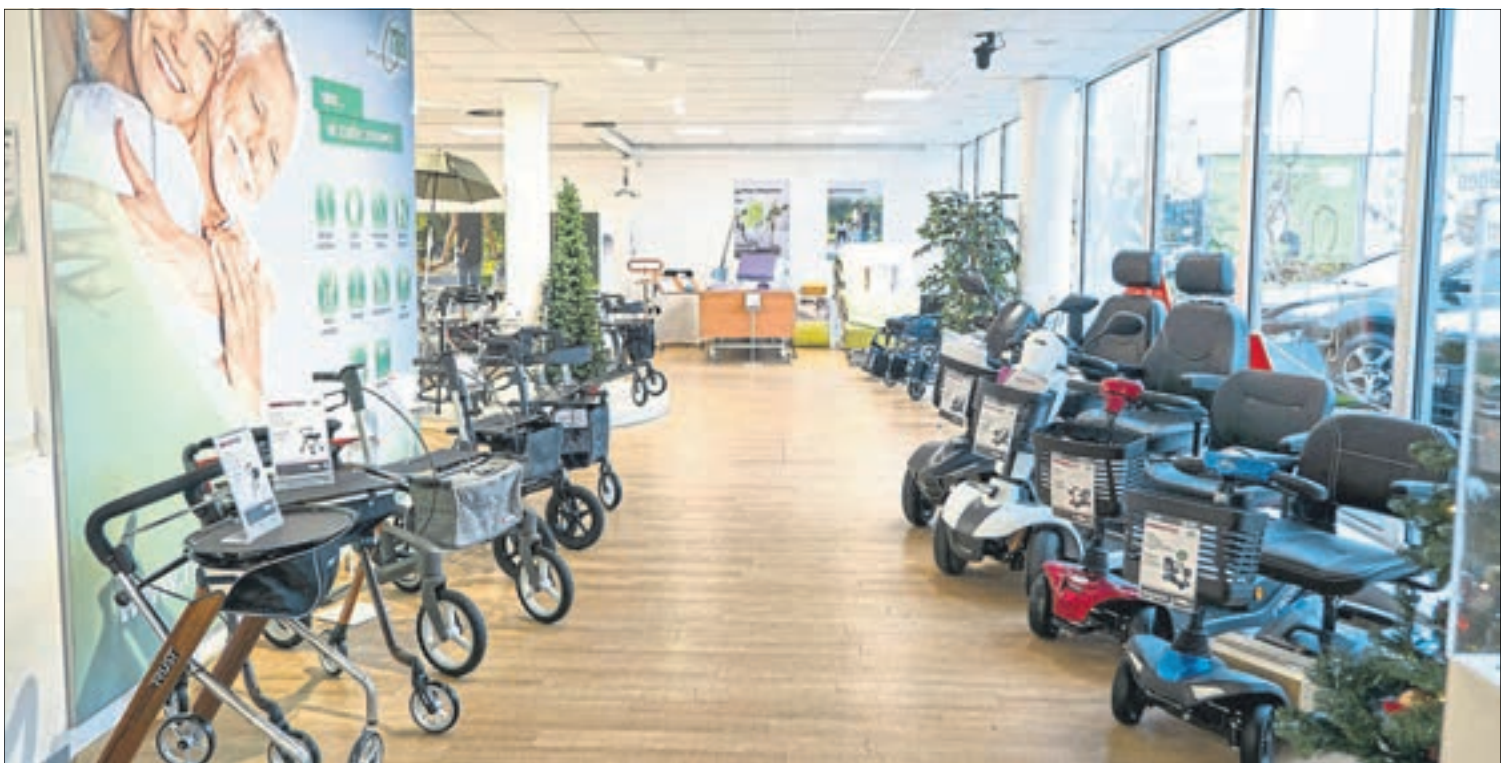
In der rahm Filiale Mülheim-Kärlich im GewerbePARK erwartet Kunden eine umfangreiche Auswahl an Mobilitätshilfsmitteln.

Wer mobil ist, ist selbstständig und hat somit eine höhere Lebensqualität