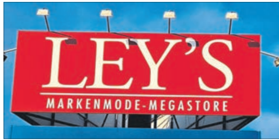
Aus dem Megastore wird der Robert Ley Flagship-Store.

Mit einem aufwendig geplanten Umbau sind die Maßnahmen rund um den LEYS Markenmoden Megastore in Mülheim-Kärlich bereits gestartet, und die Robert Ley Gruppe setzt alles daran, den Kunden zukünftig ein einzigartiges und unvergessliches Einkaufserlebnis zu bieten. Durch die umfassenden Renovierungsarbeiten wird der neue Flagship-Store nicht nur äußerlich erneuert, sondern auch im Inneren grundlegend umgestaltet. Der Store wird während der Umbauphasen durchgehend für die Kunden geöffnet sein. Ein Höhepunkt des Umbaus wird die Erweiterung des Markenportfolios sein, das den Kunden eine noch größere Auswahl an hochwertiger Mode bietet. Von internationalen Top-Marken bis hin zu exklusiven Designerstücken