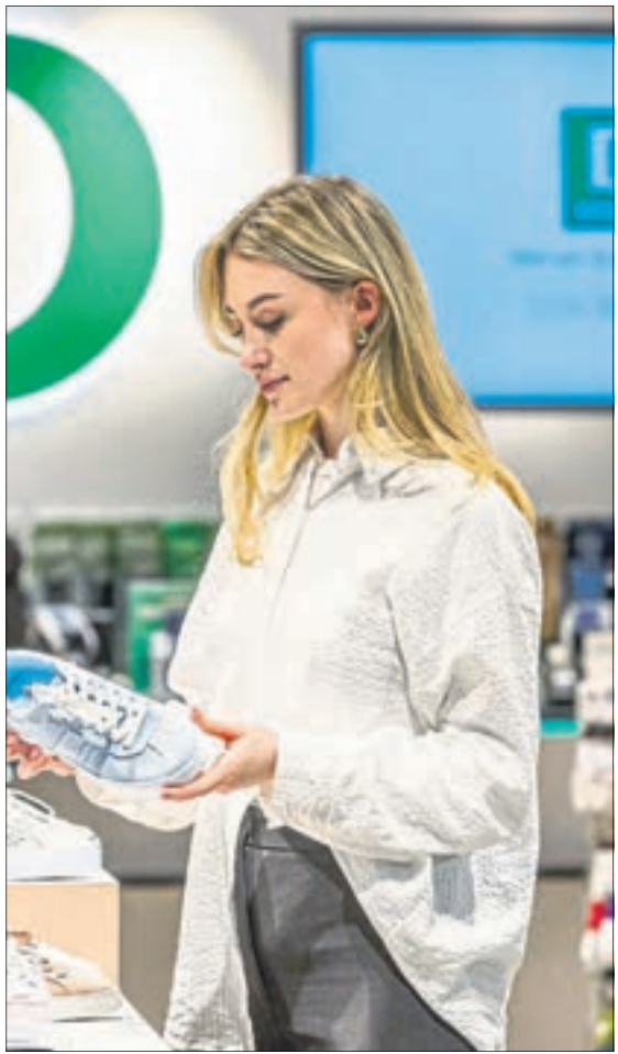
Als Überraschung wartet bei Deichmann auf die kleinen Besucher eine Glücksrad-Aktion. Das Team freut sich auf Ihren Besuch.