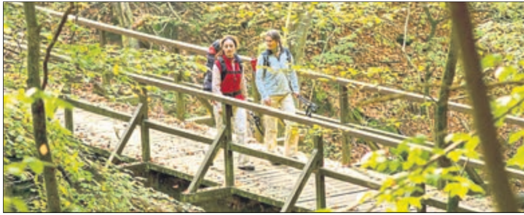
Die Holzbachschlucht zwischen Seck und Gemünden ist ein beliebtes Westerwälder Ausflugsziel für Naturfreunde. Hier treffen unberührte Wildnis und die romantische Einsamkeit des Waldes aufeinander.

Der Holzbach, welcher auf der Westerwälder Basalthochfläche am nordöstlichen Fuße des Ochsenberges bei Rennerod entspringt, durchfließt das Schutzgebiet auf einer Strecke von ungefähr anderthalb Kilometern und hat der Schlucht seinen Namen gegeben. Gewandert wird auf einem Weg, der oftmals knapp an der Böschung entlang und fast immer mit einem Ausblick auf das wildromantische Bachbett verläuft. Bereits 1929 wurde das Gebiet von der damals noch preußischen Obrigkeit als Schutzgebiet ausgewiesen. Diesen Status erneuerte das Land Rheinland-Pfalz im Jahr 1981. 2016