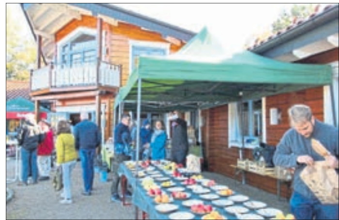
Am 6. Oktober dreht sich alles um den Apfel – inklusive Apfelpressen.

Die Will und Liselott Masgeik-Stiftung für Natur- und Landschaftsschutz aus Molsberg wird