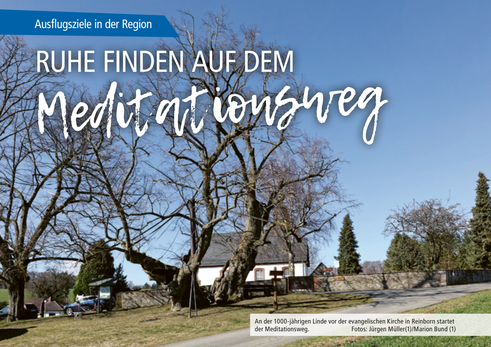
An der 1000-jährigen Linde vor der evangelischen Kirche in Reinborn startet der Meditationsweg.