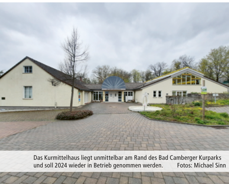
Das Kurmittelhaus liegt unmittelbar am Rand des Bad Camberger Kurparks und soll 2024 wieder in Betrieb genommen werden.