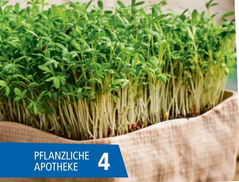
PFLANZLICHE APOTHEKE 4