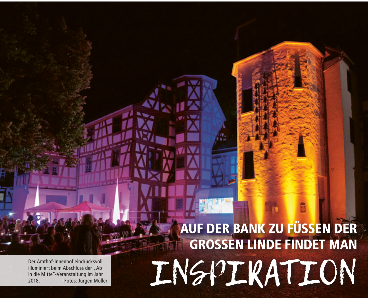
Der Amthof-Innenhof eindrucksvoll illuminiert beim Abschluss der „Ab in die Mitte“-Veranstaltung im Jahr 2018.