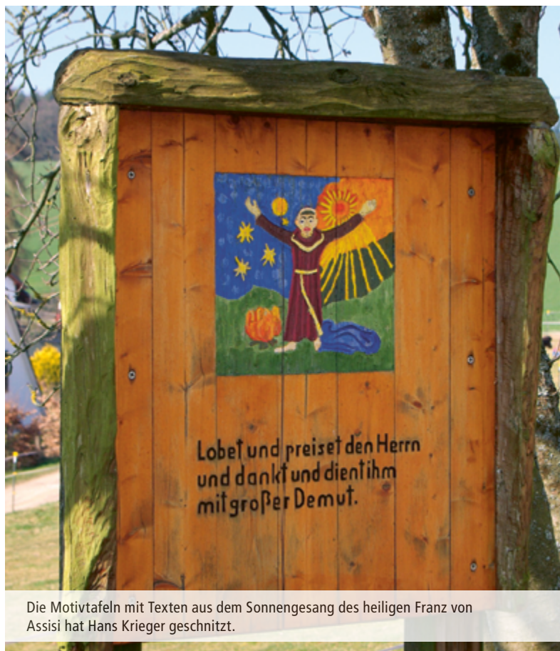
Die Motivtafeln mit Texten aus dem Sonnengesang des heiligen Franz von Assisi hat Hans Krieger geschnitzt.

Informationen sind zu finden unter https://taunus.info/angebote/sport-und-outdoor/wandern/wandertouren/meditationsweg/r-211/