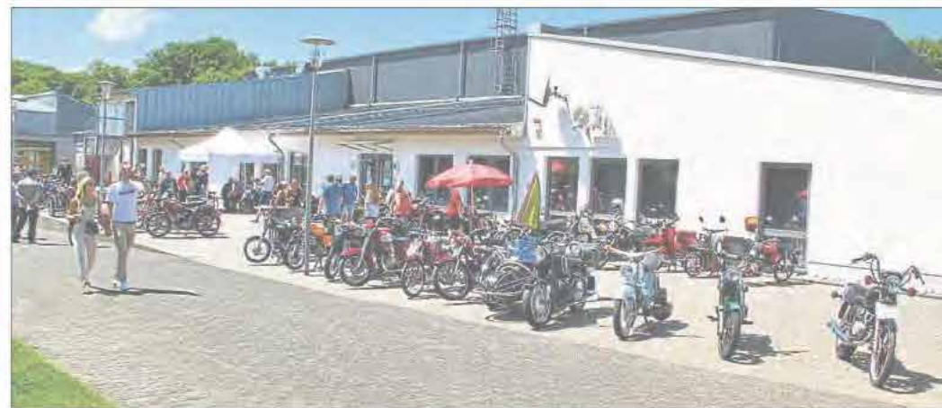
Impressionen der Wiedtal Classic 2022.

Infos gibt es unter info@wiedtal-classic.de .