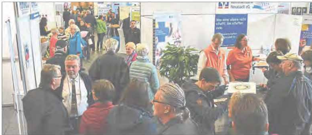
Austausch und Gespräche spielen auf der Gewerbeschau eine große Rolle.