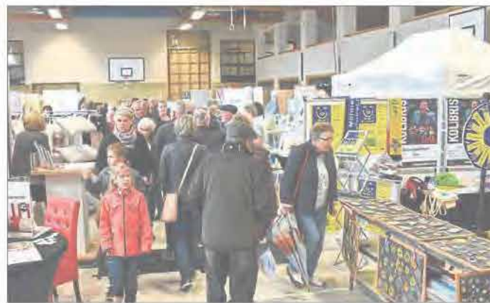
Für Groß und Klein gibt es auf der Gewerbeschau etwas zu sehen.

Auch im Umgang mit Behörden und Verwaltungen unterstützt die ISR ihre Mitglieder. So fand unter anderem eine Diskussionsrunde zwischen Schülerinnen und Schülern, Gewerbetreibenden, Eltern und Lehrpersonal unter dem Motto „Was erwarten Betriebe von ihren Auszubil-