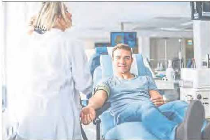
Das DRK ist mit vielen Informationen auf der ISR Windhagen vertreten.

Der Blutspendedienst appelliert an die Bevölkerung, jetzt und in den kommenden Wochen Blutspendetermine aufzusuchen. Informationen zur Blutspende sowie eine Terminsuche wird unter www.blutspende.jetzt angeboten. Da es sich um eine besonders angespannte Situation im Blutspendewesen handelt, sind Spontanspendende auch ohne Terminreservierung willkommen. Um die Blutkonserven-Lager