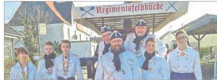
Eine gute Verpflegung des Regiments - zumindest bei den Karnevalsuzügen - hält Leib und Seele zusammen.