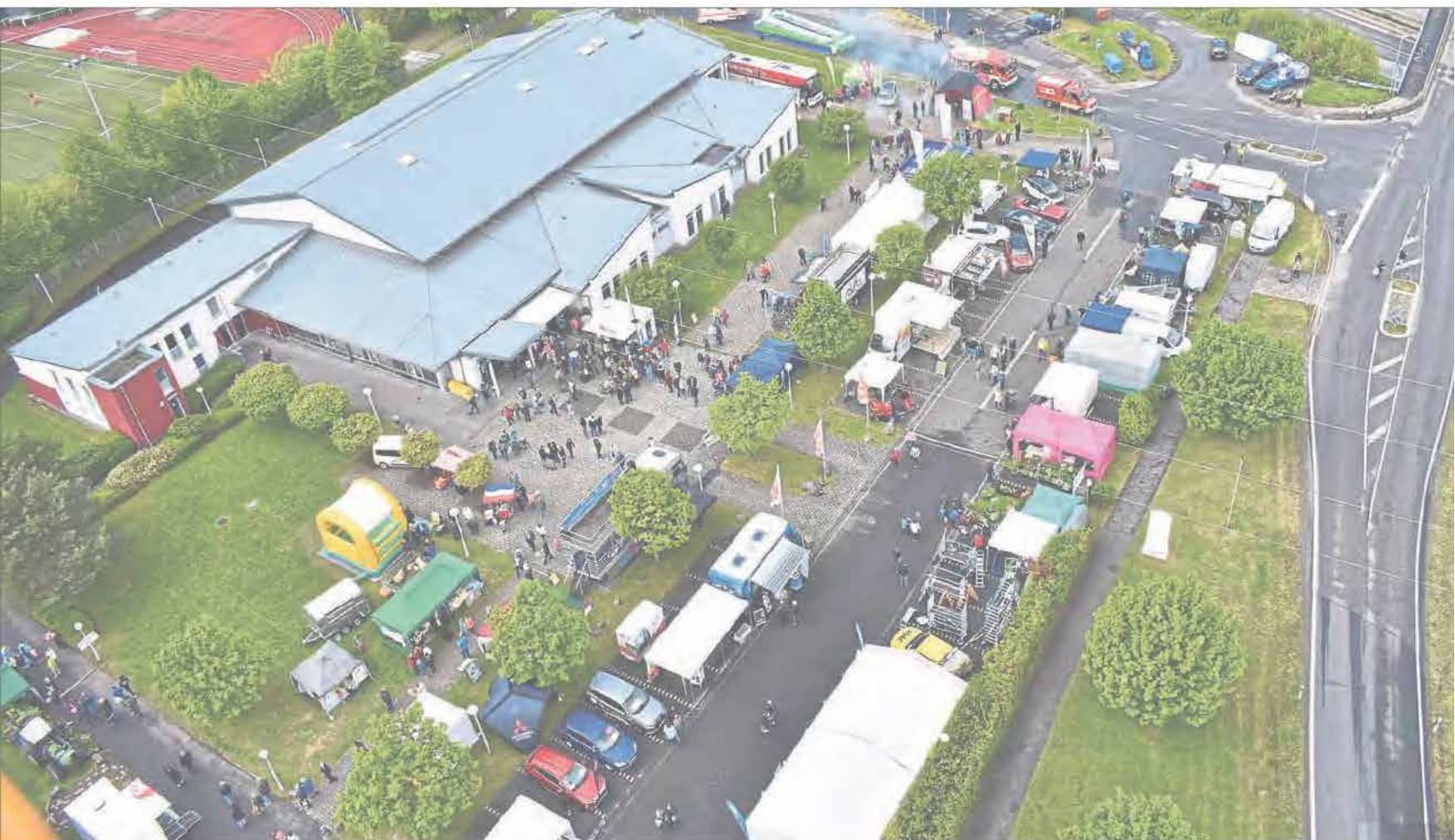
2019 öffnete die ISR-Gewerbeschau zum achten Mal ihre Pforten. Bei der Messe präsentieren sich auch in diesem Jahr wieder zahlreiche Unternehmen aus der Region. Der Besuchermagnet begeisterte beim letzten Mal rund 14 000 Besucher aus Nah und Fern.