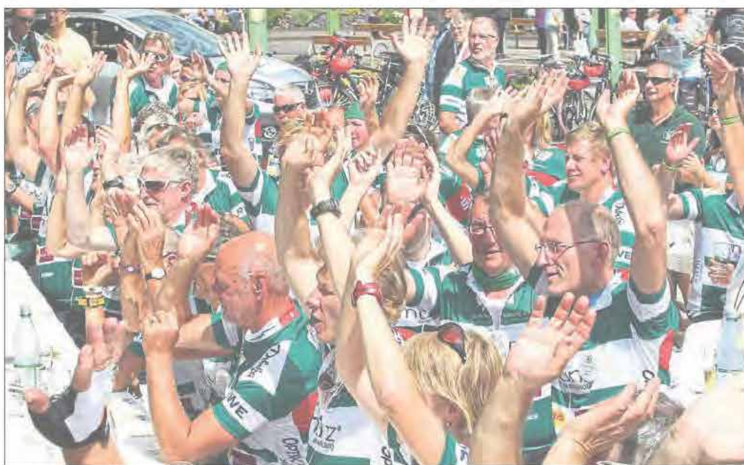
Immer aktiv: die Teilnehmer der VOR-TOUR.

Diese Tatsache macht die größte Benefiz-Radtour Deutschlands so bemerkenswert. Die mittlerweile sehr hohe Akzeptanz in den Bereichen Wirtschaft, Politik und Sport und die Tatsache, dass alle Spendengelder zu 100% dort ankommen, wo sie dringend gebraucht werden, hat dazu geführt, dass jährlich immer weit über 1 Millionen Euro verteilt werden konnten.