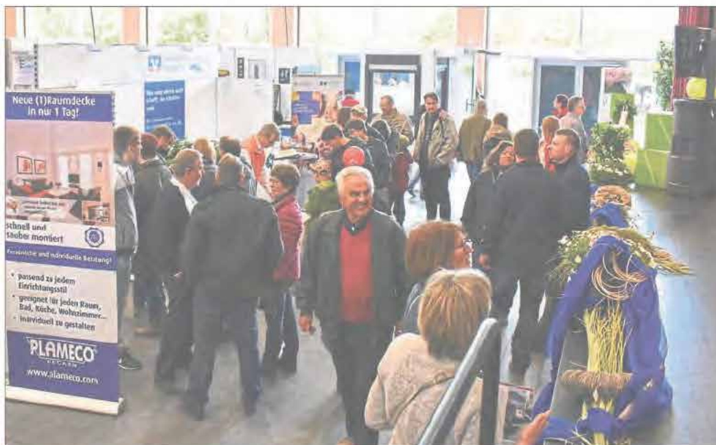
Vielerlei Informationen erhalten Interessierte an den Messeständen der heimischen Unternehmen.

LIVE MUSIC - ENGLISCHE SPEZIALITÄTEN WIE FISH N CHIPS - ENGLISCHES BIER