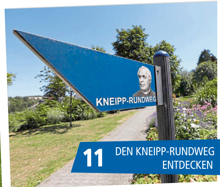
11 DEN KNEIPP-RUNDWEG ENTDECKEN