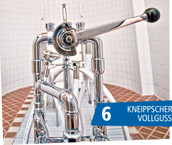
6 KNEIPPSCHER VOLLGUSS