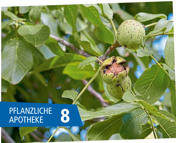
PFLANZLICHE APOTHEKE 8