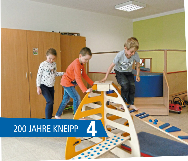
200 JAHRE KNEIPP 4